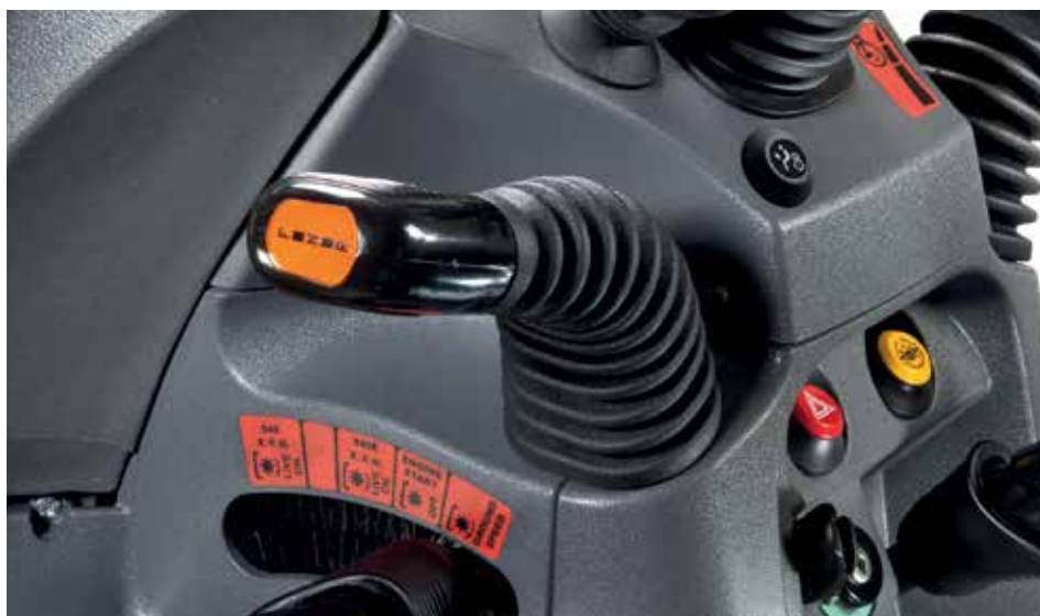
FAHRGESCHWINDIGKEIT IN KM/H DES MECHANISCHEN SCHALTGETRIEBES 12+12

ausreichend. Der Solaris weist ein robustes Fahrwerk auf, das konzipiert wurde, um schwere Stützlasten (je nach Bereifung bis zu 600 kg) und Anhängelasten an der Kupplung (bis 4.000 kg) standzuhalten.