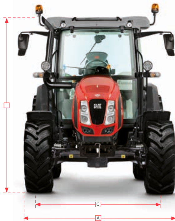
Explorer LD (MY 2019)