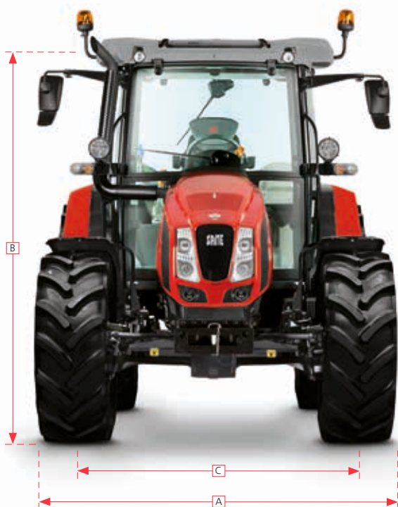
Explorer MD (MY 2019)